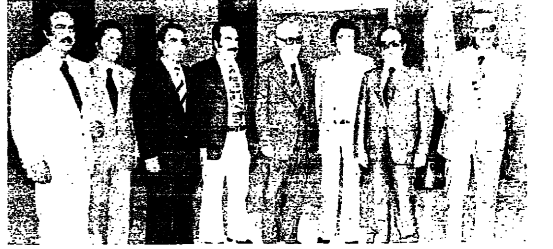
وفد الاتحاد العمالي العام الذي زار مصر بعيدا أمس

أبلغ الرئيس سليمان فرنجة وفدا مشتركا من الاتحاد العمالي العام واتحاد عمال فلسطين، أن القضايا